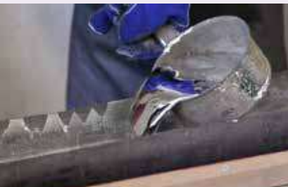
Coulage à la feuille d'étain de la fabrication des tuyaux, mise en œuvre par la société Koenig, facteurs d'orgues.

Des 58 tuyaux ajoutés, les 20 plus grands sont en bois et les 38 suivants en alliage de plomb et d'étain. Ils sont l'œuvre d'artisans spécialisés, tenants d'un savoir-faire traditionnel alliant esthétique, mécanique et harmonie. En augmentant et optimisant la palette de couleurs et de timbres, l'ensemble permet d'interpréter un répertoire plus conséquent : pour en révéler tout le potentiel, Philippe Pouly interprétera l'œuvre unique d'Olivier Messiaen « La Nativité du Seigneur », qui, en 1935, renouvelait totalement l'écriture de l'orgue.