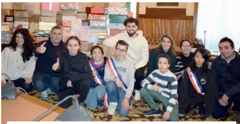
Tri et emballage des boîtes par les Conseils des Enfants et des Jeunes, avant la distribution aux familles.

Ces boîtes ont été remises au Secours Populaire le 14 janvier 2025. Une belle preuve que la solidarité reste une valeur fondamentale au cœur de notre communauté.