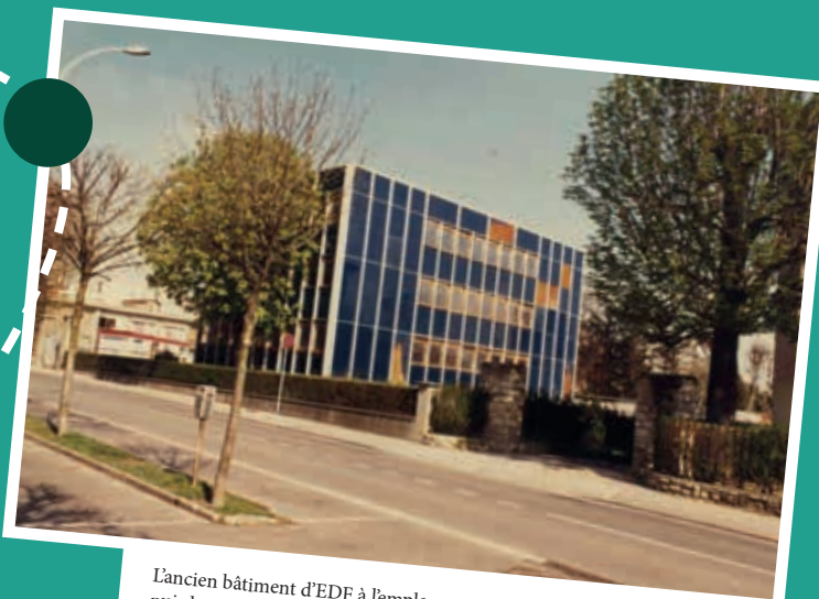
L'ancien bâtiment d'EDF à l'emplacement de l'actuel conservatoire, sa destruction, puis la construction à partir de 1989 et le bâtiment d'aujourd'hui.