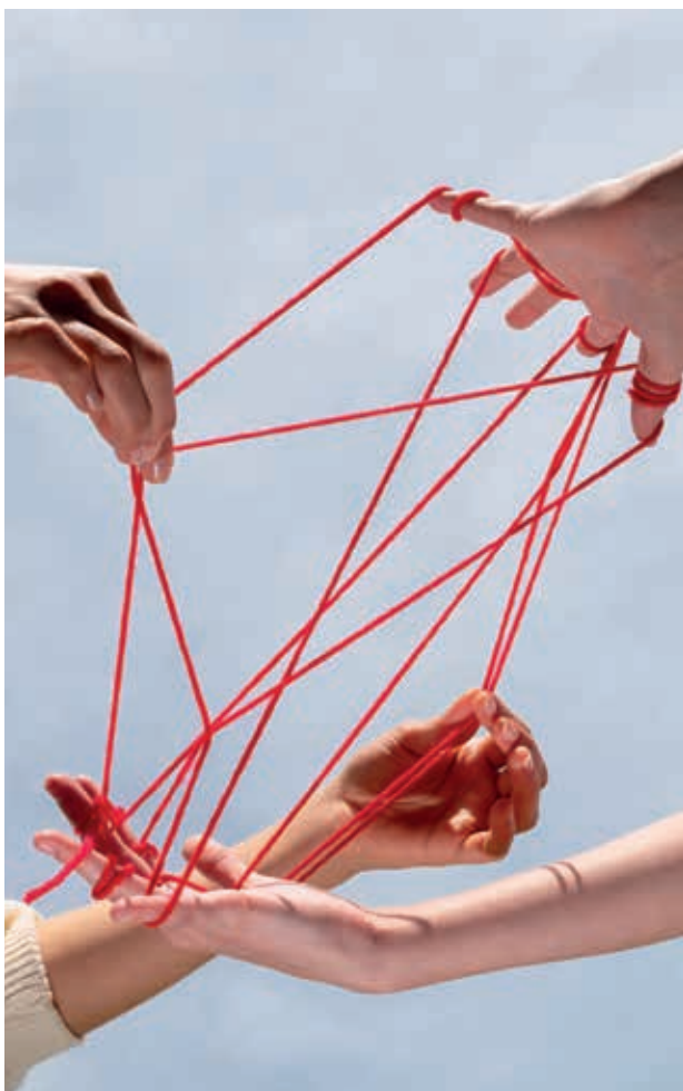
TABLE RONDE SUR LES DÉFIS POUR LA COHÉSION DE LA SOCIÉTÉ FRANÇAISE

Le vendredi 13 février à 19h30, une table ronde proposée par la Ligue Internationale Contre le Racisme et l'Antisémitisme (LICRA) réunira :