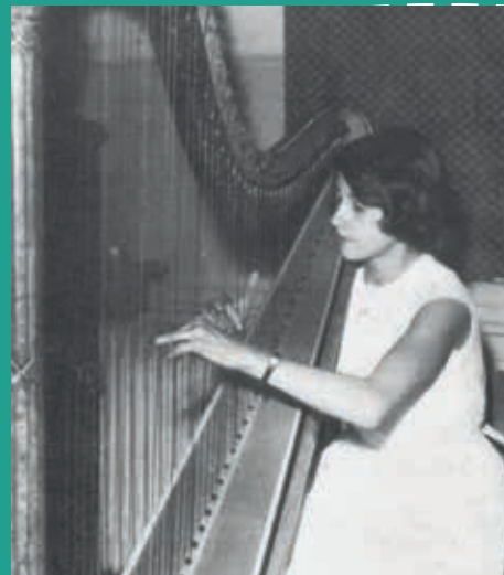
Auditions d'élèves en 1965, il y a 60 ans.